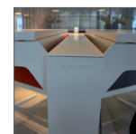
Top over screen